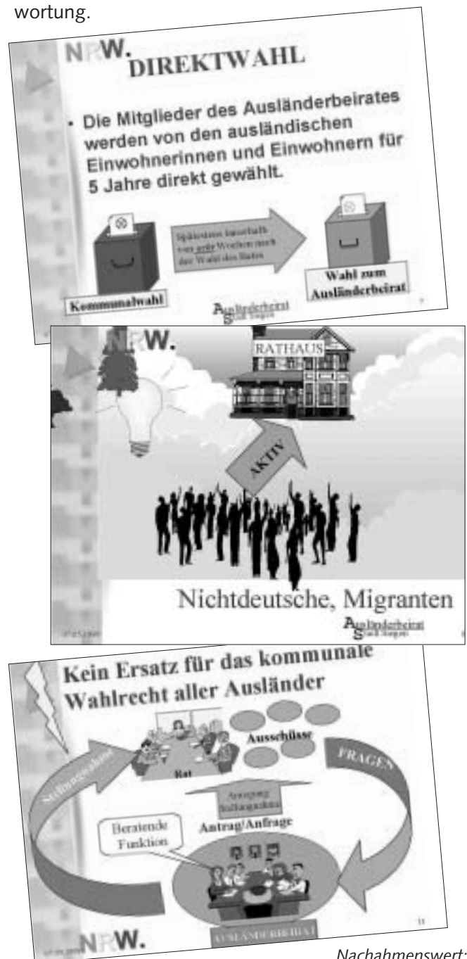
Nachahmenswert: CD-Rom des Ausländerbeirats Siegen

Teilweise können Ausländerbeiräte „ihre eigene“ Öffentlichkeitsarbeit betreiben, also in eigener Verantwortung.